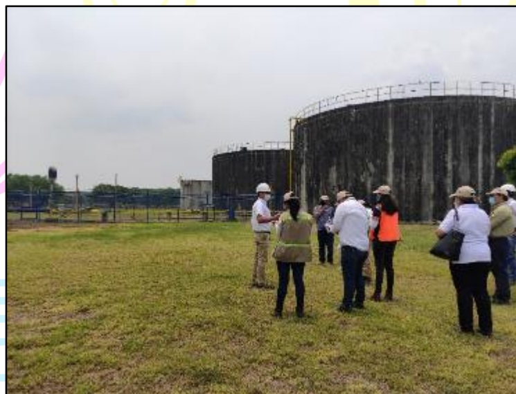
Figura 5 Sitio para la instalación del gasómetro y microturbinas