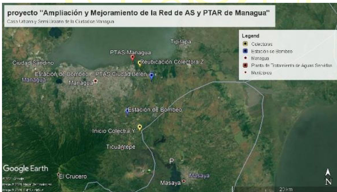
Figura 1 Microlocalización del proyecto "Ampliación y Mejoramiento de la Red de Alcantarillado Sanitario y Planta de Tratamiento de Aguas Residuales de la Ciudad de Managua"

Vamos Adelante! CON AMOR, ESPERANZA Y ALEGRÍA!