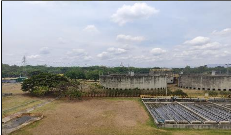
Figura 8 Sitio propuesto para la construcción de los sedimentadores sec.

En el Tratamiento secundario la unidad de sedimentación secundaria se construirá e instalará 4 sedimentadores adicionales, actualmente existen 8 unidades de sedimentadores (Ver Figura 8). En el área se observó un árbol adulto de especie Guanacaste Blanco.