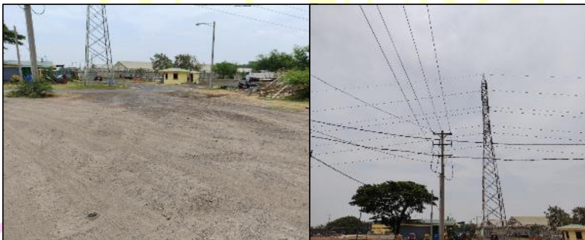
Figura 12 Sitio propuesto para ampliación de los sedimentadores primario

En las unidades de tratamiento primario para la Sedimentación primaria se construirá e instalara 3 unidades, actualmente en funcionamiento son 9 unidades de sedimentadores. Se observó cableado eléctrico aéreo y una torre de distribución eléctrica de alta tensión (Ver Figura 12).