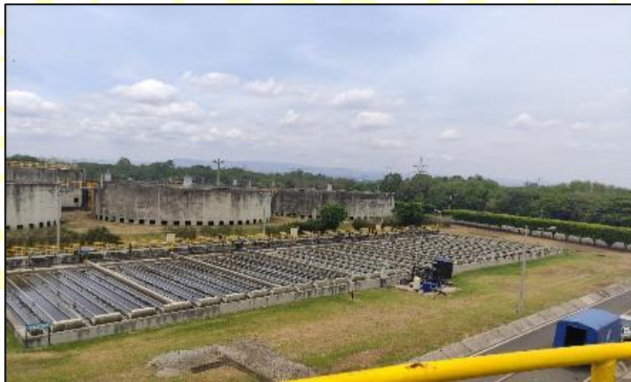
Figura 4 STARD de la ciudad de Managua

Se realizó visita y recorrido en la Planta Augusto César Sandino, Planta de Tratamiento de Aguas Residuales Domésticas de la ciudad de Managua (Ver Figura 4), se inspeccionaron las unidades que requieren modificaciones y ampliaciones, tales como la unidad de tratamiento de: Los Digestores de Tratamiento de Lodos se instalara un quinto digestores, actualmente existen 4 unidades de digestores. Se observó un área verde amplia destinada para la quema de metano (Ver Figura 5). También se instalará una unidad de generación de energía, se instalará un gasómetro y paquete de microturbina, nuevas unidades en la PTARD.