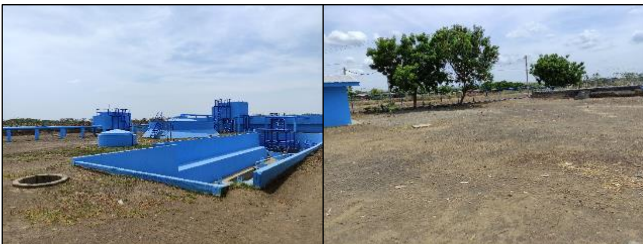
Figura 14 Planta Inhabilitada y sitio para la ubicación EBAR N°1