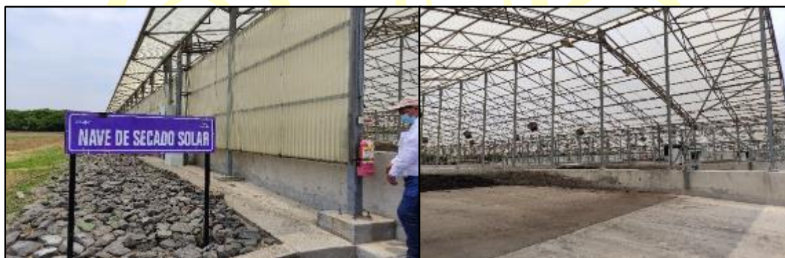
Figura 6 Naves de secado para el tratamiento de lodos

En las unidades de Prensa y secado en el tratamiento de lodos se construirán e instalaran 3 naves de secado para lodos, actualmente se encuentran 6 naves existentes (Ver Figura 6), se observó que a 40 m se encuentra una caja de registro de cableado eléctrico. Se reemplazarán 2 prensa de banda para la deshidratación con otras de mayor capacidad que las prensas de banda existentes.