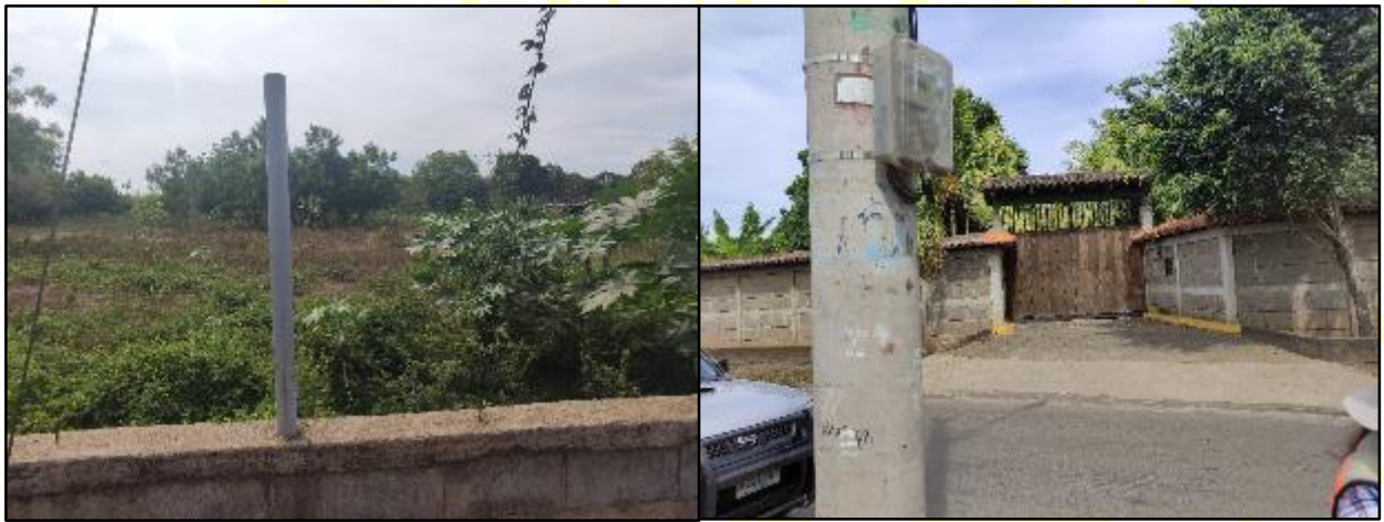
Figura 16 Sitio propuesto para la construcción de EBAR N°2

El sitio propuesto para la construcción e instalación del EBAR N°2 ubicado en el Ramal Oeste del Colector Y en el sector de Esquipulas, en el punto 587558 E y 1335075 N, se observó un terreno baldío, rodeado por viviendas, calle de acceso pavimentada. Las aguas residuales serán impulsadas al Interceptor 3