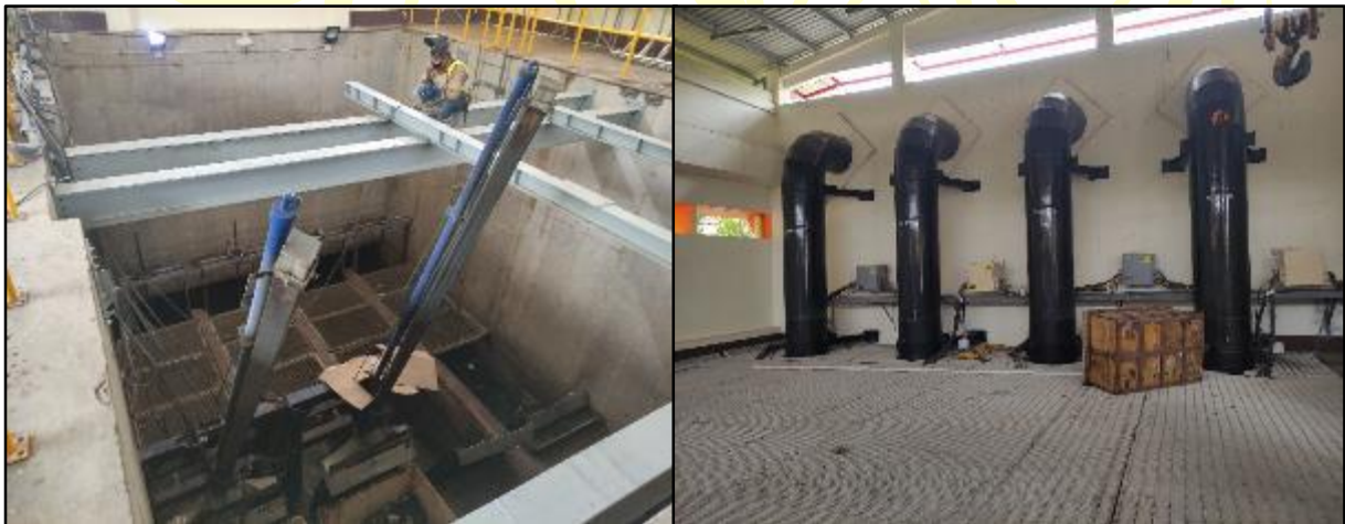
Figura 10 Actividades complementarias y de mantenimiento