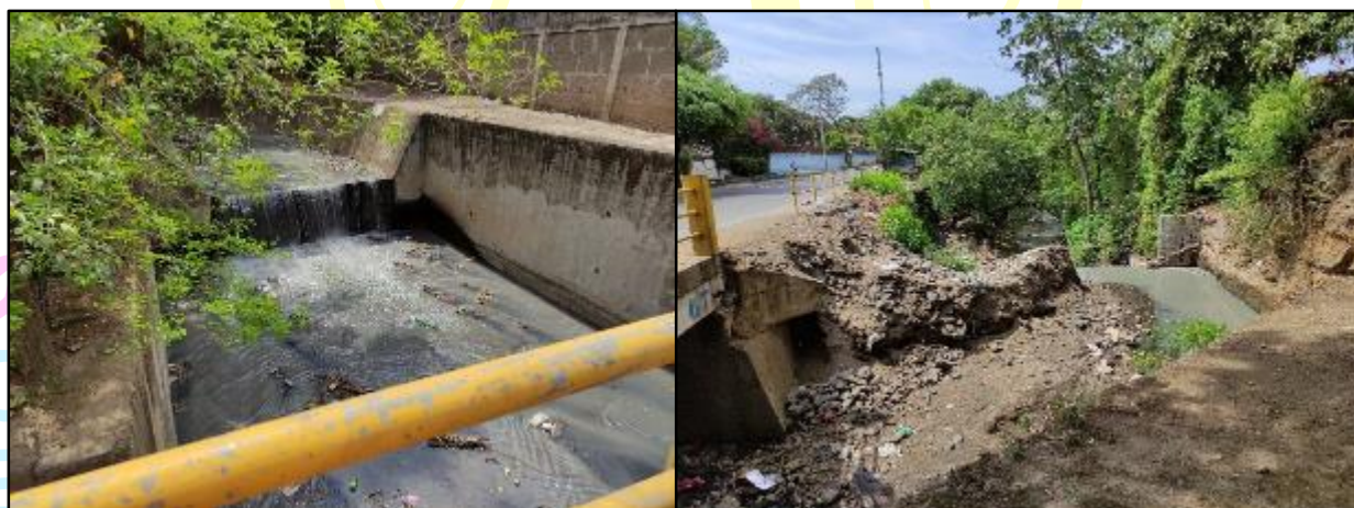
Figura 15 sitio para la instalación del cruce aéreo en el cauce revestido

Se visitó el sitio donde se construirá e instalara el cruce aéreo con el objetivo de no afectar la infraestructura del puente existente del cauce revestido en el Barrio Manuel Fernández del Distrito VII, durante la visita se observó que en el cauce cursas aguas negras provenientes desde Villa Libertad (Ver Figura 15).