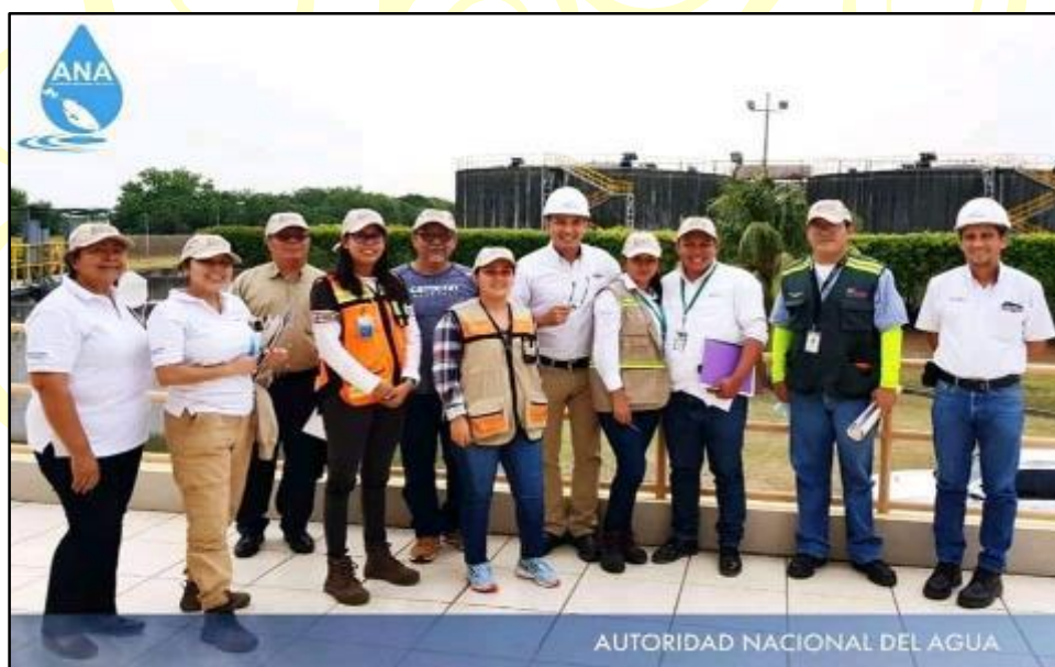
Figura 3 Comité Interinstitucional solicitud de Permiso Ambiental Proyecto Ampliación y Mejoramiento de la Red de Alcantarillado Sanitario y Planta de Tratamiento de Aguas Residuales de la Ciudad de Managua