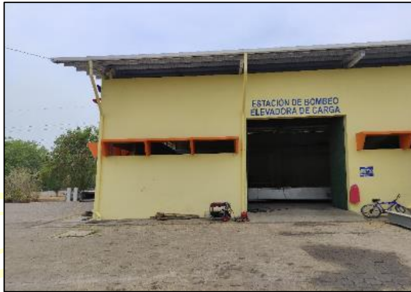
Figura 9 Estación de Bombeo Elevadora de Carga