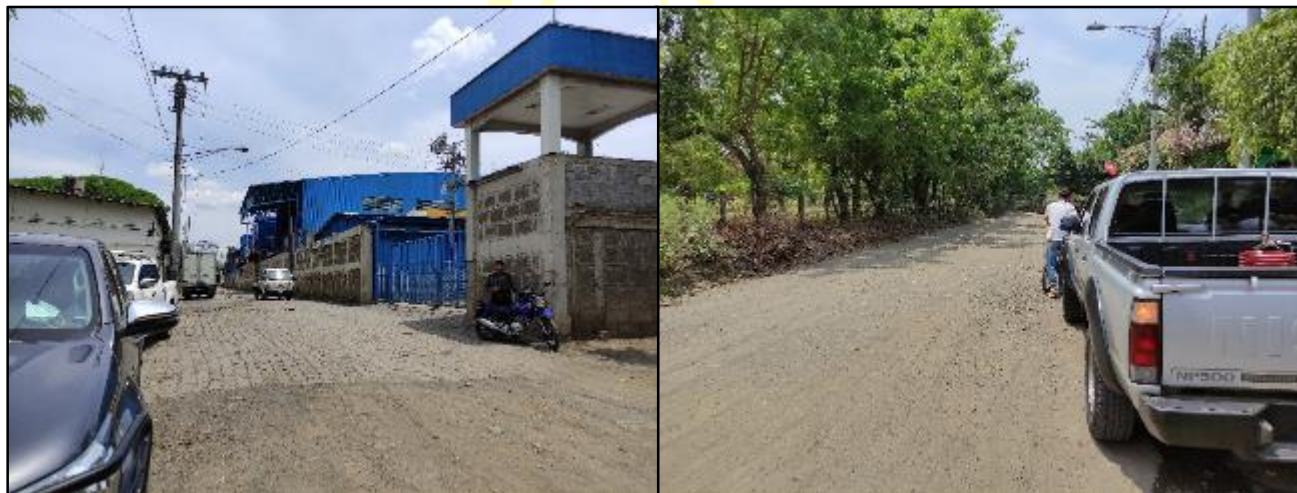
Figura 13 Sitio de Reubicación de la Colectora ZZ

El sitio propuesto para la reubicación de la Colectora Z, se ubica en orientación norte de la empresa Nuevo CARNIC, se instalará una tubería de PVC de 2.7 de Km, se observó camino de acceso y casas alrededores (Ver Figura 13).