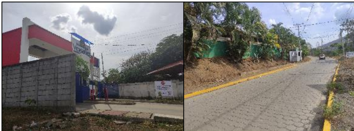
Figura 17 Punto de apertura para la construcción de la Colectora Y