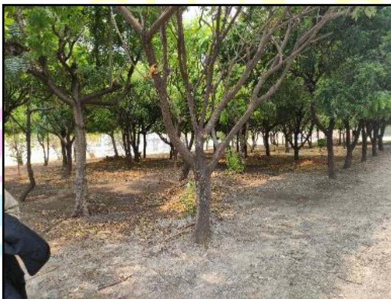
Figura 7 Área destinada para la instalación del proceso de desinfección

En el tratamiento de filtración y desinfección del efluente se instalará 9 filtros discos de gravedad con 4 canales de desinfección UV, son unidades nuevas en el PTARD, se observó un área de \frac{1}{4} de manzana arborizada por especies de Nynn (Ver Figura 7).