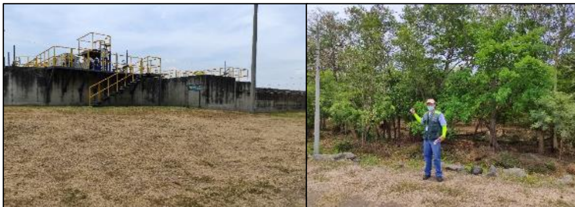
Figura 11 Ampliación para la unidad de desarenadores y desangrasadores

En las unidades de tratamiento primario para la Sedimentación primaria se construirá e instalara 3 unidades, actualmente en funcionamiento son 9 unidades de sedimentadores. Se observó cableado eléctrico aéreo y una torre de distribución eléctrica de alta tensión (Ver Figura 12).