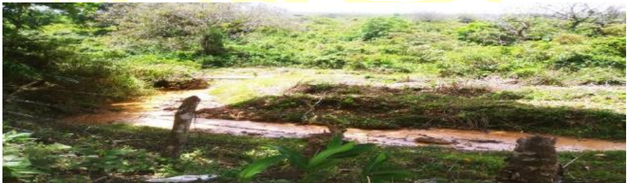
Figura 5, Quebrada El Cedro / Santo Domingo, Departamento de Chontales

Área de Confluencia de las quebradas el Cedro con la quebrada La Leona se observó lo siguiente: