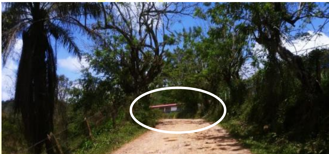
Figura 2 Centro educativo Santo Domingo / Ubicada en los alrededores del Proyecto.