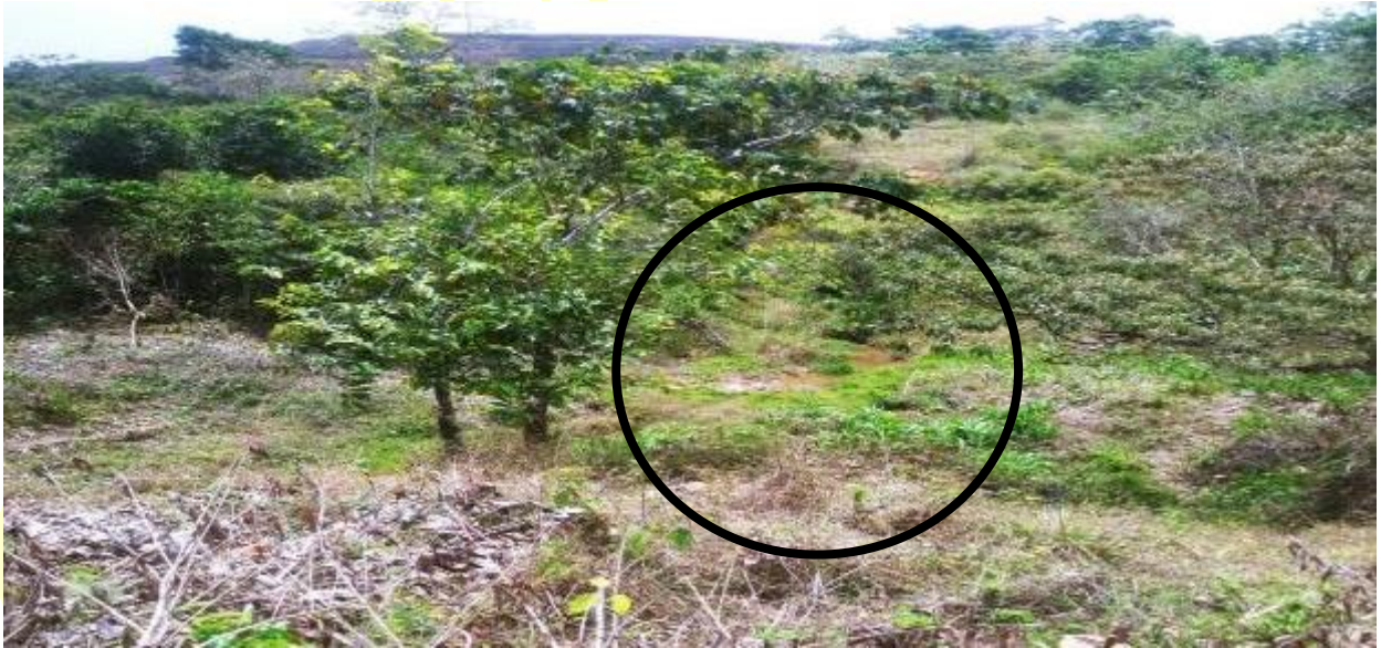
Figura 6, Confluencia Quebrada La Leona y Quebrada El Cedro