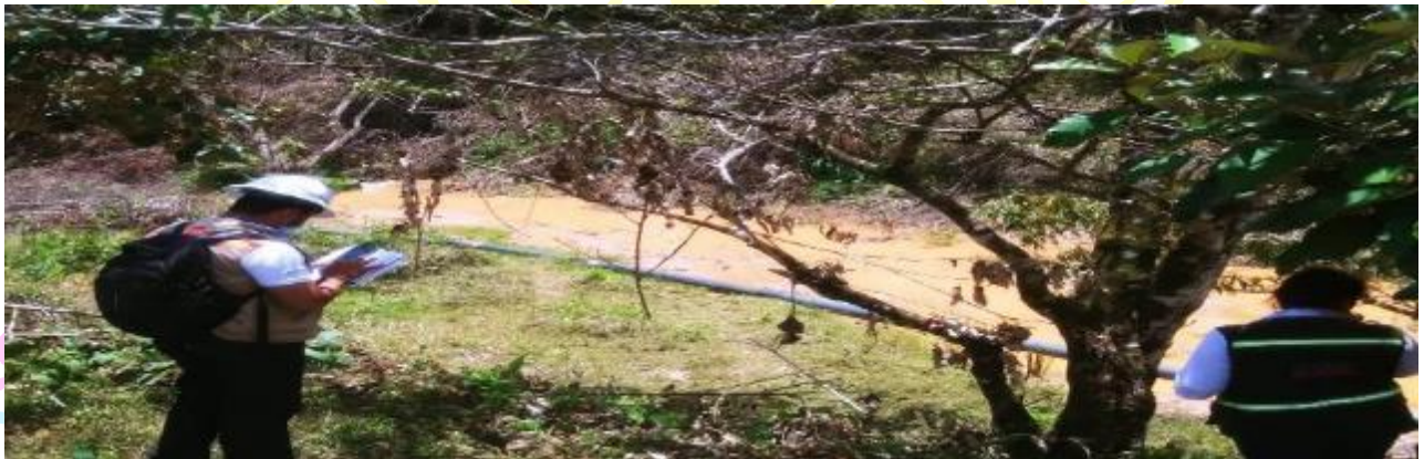
Figura 7. Tramo que forma parte del Proyecto Confluencia Quebrada El Cedro y La Leona