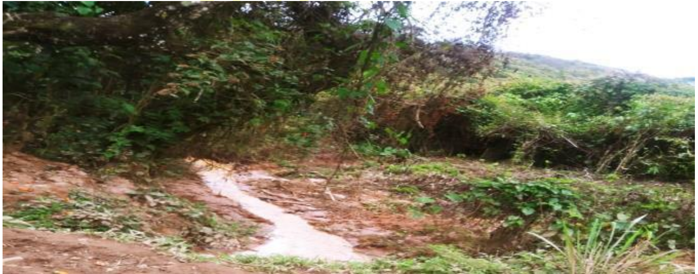
Figura 4 Quebrada El Cedro / Santo Domingo, Departamento de Chontales