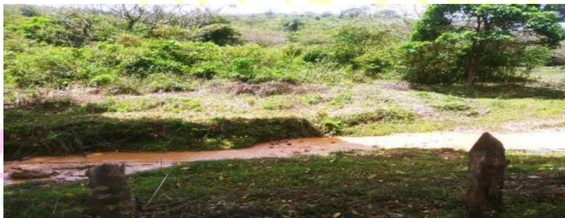
Figura 3 Quebrada El Cedro / Santo Domingo, Departamento de Chontales